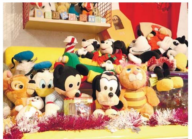
クリスマスやギフトにも