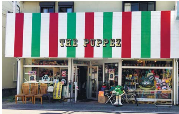
松本をポップで楽しい街に