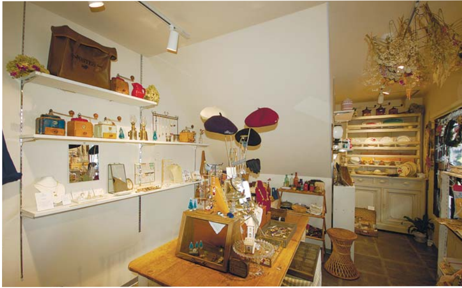
店内には所狭しと商品が並び

当初は息抜きのため、1年間、ワーキングホリデー制度を利用して、フランスに行くことにしました。 最初は息抜きのつもりでしたが、1年間で、フランスの暮らしが気に入りました。その後も語学学校に入り、その後、フランスの道具市にもよく足を運んで、アルバイツ販売をして暮らすことにしました。日本食レストランでの