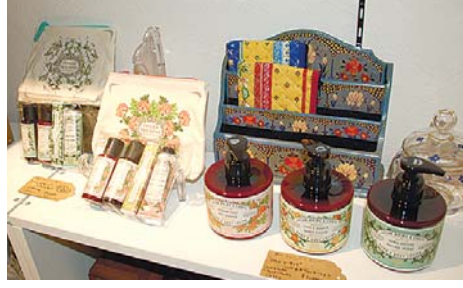
手ごろな価格のギフト商品