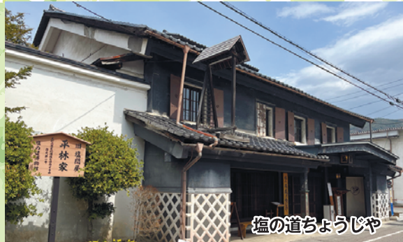
塩の道ちょうじや

塩や海産物が運ばれた 「千国街道・塩の道」をたどりつつ、 雄大な北アルプスの景色や 国宝仁科神明宮などの文化史跡を巡ります