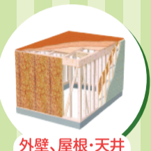
外壁、屋根・天井 床の断熱改修