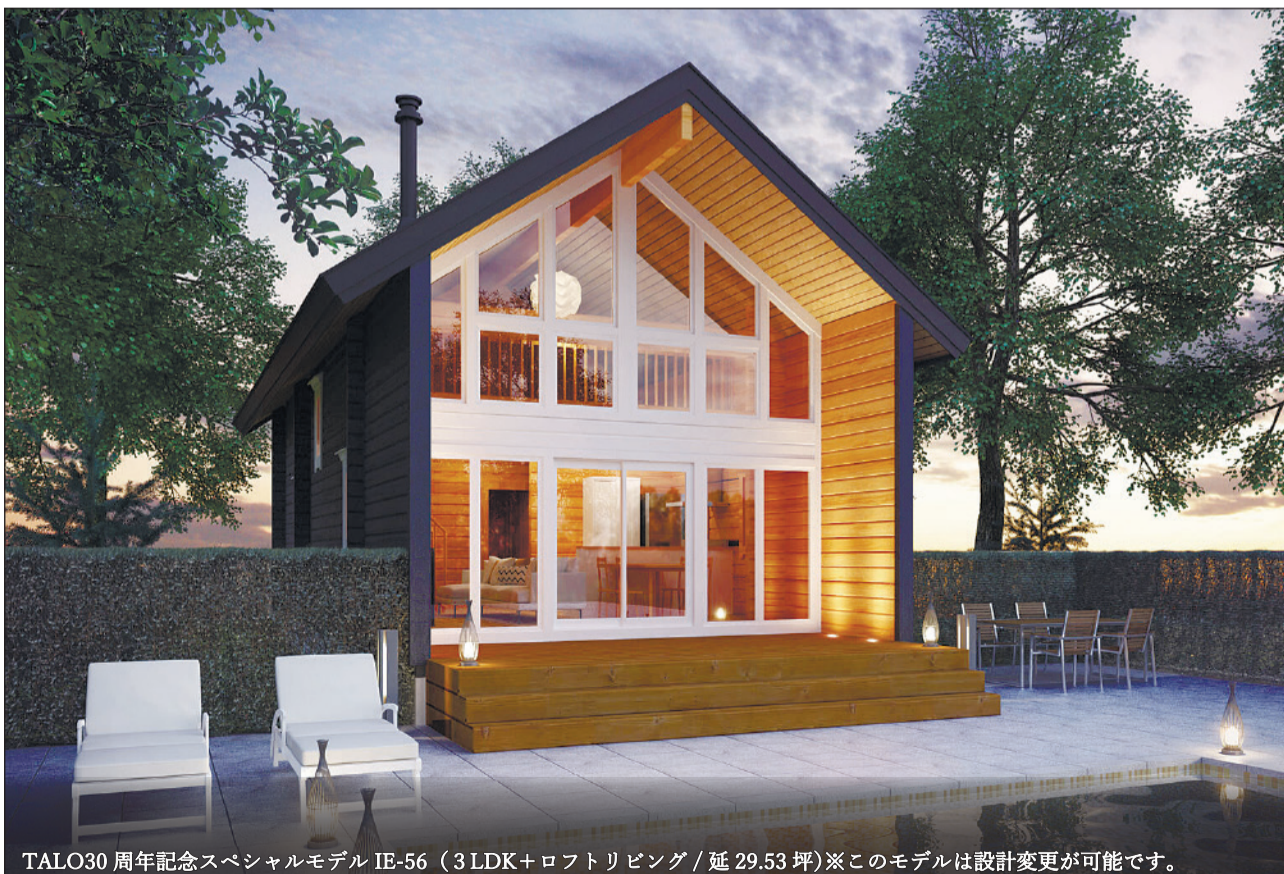
TALO30周年記念スペシャルモデル IE-56 (3LDK+ロフトリビング/延29.53坪)※このモデルは設計変更が可能です。