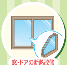
窓・ドアの断熱改修