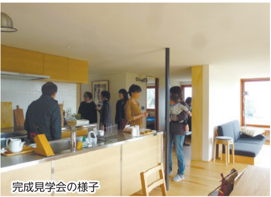
完成見学会の様子

お客様とご縁を大切にしており、10年、20年とお付き合いが続いているお客様が少なくありません。その絆づくりの一助になっているのが広報誌「暮らしの広場」です。毎月1回、弊社からのお知らせやお得情報、おすすめ商品、補助金などの最